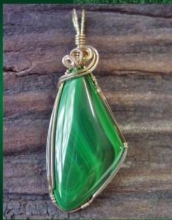
Кулон из малахита

Народные целители считают, что малахит является прекрасным средством от болезней кожи. Браслеты из малахита очищают кожу от аллергических высыпаний и красных пятен. Бусы из малахита, по мнению знахарей, помогают значительно улучшить рост волос. Литотерапевты предполагают, что этот минерал может облегчить приступы бронхиальной астмы, лечить заболевания глаз, улучшить зрение.