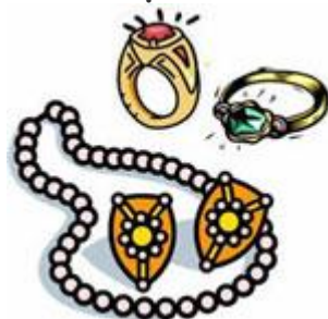
Жемчуга и золотые перстни