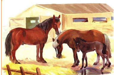
КОНЬ ЛОШАДЬ ЖЕРЕБЁНОК