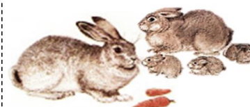
КРОЛИК КРОЛЬЧИХА КРОЛЬЧАТА