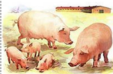
КАБАН СВИНЬЯ ПОРОСЯТА