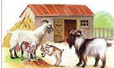
КОЗЁЛ КОЗА КОЗЛЯТА