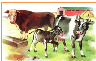
БЫК КОРОВА ТЕЛЁНОК

А зовут его ... (цыпленок) Мама собака сбилась с ног: «Куда же пропал мой сыночек...?» (щенок) Вот крадется мама кошка, Кого зовет она в лукошко. (котят) Медведица громко рычит, кто к ней торопится, спешит? (медвежата) Зайчиха зовет своих ребят – Длинноухих сереньких... (зайчат) Утка важная идет, Своих детей к реке ведет. (утята) «Хожу в пушистой шубке, Живу в густом лесу. В дупле на старом дубе Орешки я грызу (белка) Позову своих ребят Озорных своих... (бельчат)