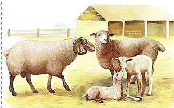
БАРАН ОВЦА ЯГНЯТА